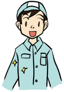
よご 汚れがとれました